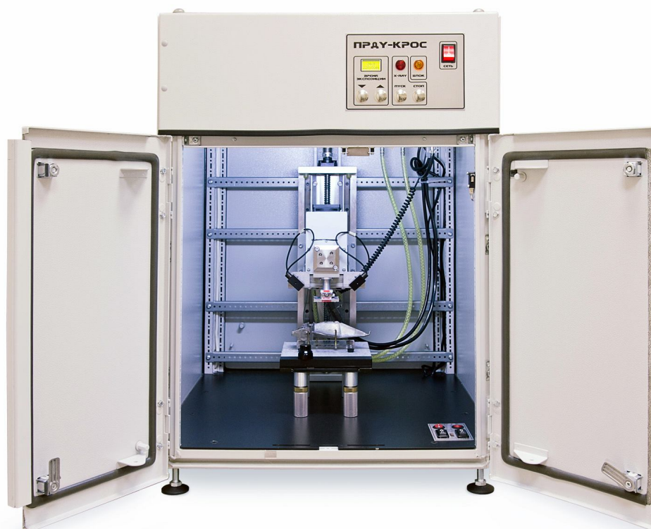
Рис. 1: Внешний вид дифракционной установки ПРДУ «КРОС»

Разработанная модификация установки ПРДУ «КРОС» (рис. 1) для определения ориентации образцов-монокристаллов по обратным лауэграммам (эпиграммам) включает в себя рентгенозащитную камеру (в которой размещены двухкоординатный столик образца и штатив, несущий блок «излучатель-детектор»), лазерный сканер для считывания дифракционной картины с плоского позиционно-чувствительного детектора, ПК со специализированным программным обеспечением. Острофокусная трубка мощностью 100 Вт позволяет за время 1-2 минуты зарегистрировать эпиграмму от участка образца диаметром 0,5-1,0 мм.